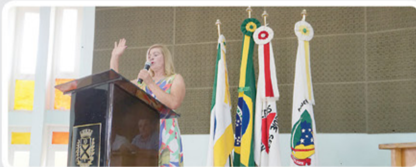
28ª Reunião Ordinária

possam cursar o ensino superior; Projeto de Lei nº 2980, que institui o regime de sobreaviso ou plantão à distância para o cargo de médico Pronto Atendimento - Tem a finalidade específica de atender serviços emergenciais, ininterruptos e essenciais à coletividade na Secretaria de Saúde, para que assim o médico possa ser chamado a qualquer momento e com remuneração de 50% menor em relação a hora normal de plantão. Acompanhe tudo o que acontece na Câmara de Vereadores de Extrema acessando o Facebook Oficial da Casa de Leis e o site www.camaraextrema.mg.gov.br .