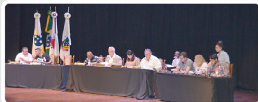
29ª Reunião Ordinária