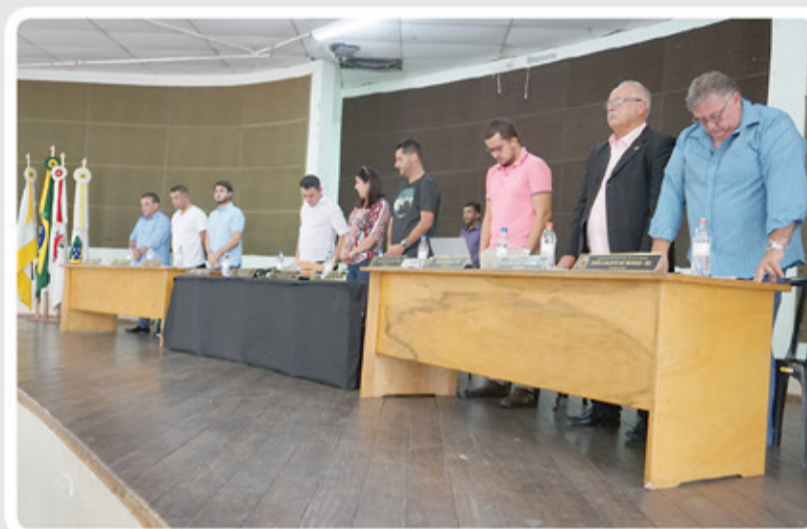
28ª Reunião Ordinária