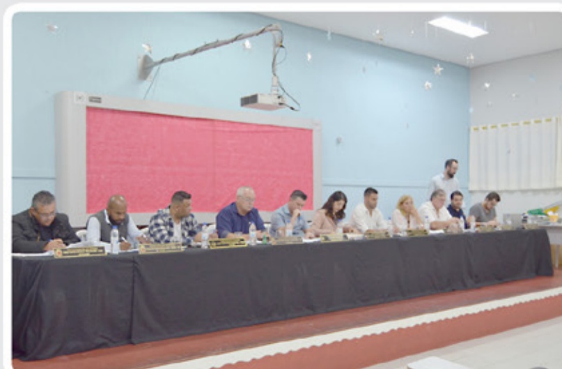
31ª Reunião Ordinária