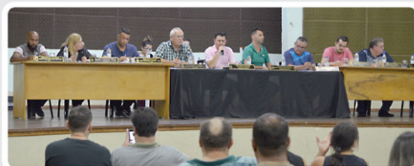
30ª Reunião Ordinária